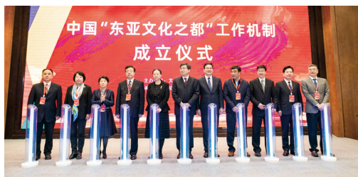
图② 敦煌参加中国“东亚文化之都”工作机制成立仪式