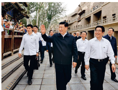
图⑦ 2019年8月19日，习近平总书记视察甘肃首站来到敦煌

共建“一带一路”，加强同沿线国家的文化交流，增进民心相通。去年，敦煌市有幸当选2021年东亚文化之都城市，我们将以此为契机，深入贯彻落实习近平总书记视察敦煌重要讲话精神，推动敦煌文化服务共建“一带一路”，积极主动融入文都建设，把闪亮的文都招牌和深厚的文化底蕴相结合，持续加强与日本、韩国等国家及国内文都城市的交流合作。