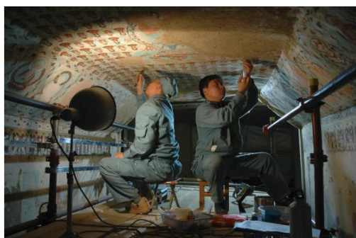
图⑧ 敦煌壁画的修复

育 引进《敦煌盛典》《丝路花雨》《又见敦煌》等文化演艺项目，开发文博体验、乡村休闲、户外运动、沙漠露营等新业态，研发壁画临摹、微电影制作、彩陶制作等旅游研学产品，敦煌礼物、敦煌故事、洛小北等一批文创企业发展壮大，念念敦煌、如梦敦煌等千余款文创产品相继推出，以文化旅游产业为主的第三产业增加值占GDP比重超过70%。