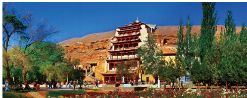
图④ 世界文化遗产—莫高窟

“敦煌”二字，取盛大辉煌之意、寓繁荣昌盛之愿，自汉武帝凿空西域，“据两关、列四郡”起，已有2100多年的历史，是古丝绸之路上的“第一枢纽城市”，也是中国历史上率先向西方开放的地区，中华文明经此远播欧亚，万里丝路在此联通交汇，多元文化聚此美美与共，孕育了“开放包容、向善守正、崇高唯美”的敦煌文化精神。