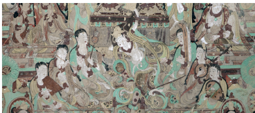
图⑤ 敦煌莫高窟壁画-“笙、箫、管、笛”样样俱全的大乐队

界文化遗产、两大世界自然奇观、一大著名国际显学六张享誉世界的“名片”，境内现存莫高窟、玉门关、悬泉置3处世界文化遗产，拥有国家5A级旅游景区鸣沙山月牙泉、雅丹世界地质公园等世界自然奇观，自1900年藏经洞发现以来风靡全球、长盛不衰的“敦煌学”，是丝绸之路上最负盛名的国际学术宝库。