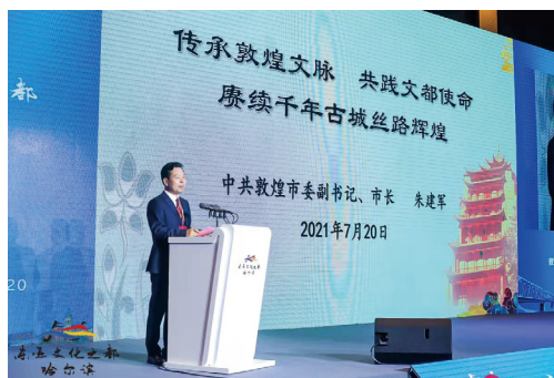
图③ 敦煌参加哈尔滨“东亚文化之都”开幕式活动

“敦煌”二字，取盛大辉煌之意、寓繁荣昌盛之愿，自汉武帝凿空西域，“据两关、列四郡”起，已有2100多年的历史，是古丝绸之路上的“第一枢纽城市”，也是中国历史上率先向西方开放的地区，中华文明经此远播欧亚，万里丝路在此联通交汇，多元文化聚此美美与共，孕育了“开放包容、向善守正、崇高唯美”的敦煌文化精神。