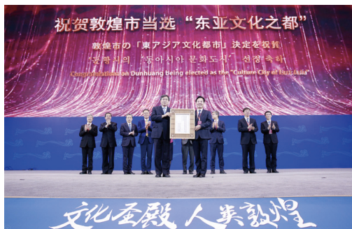
图① 敦煌入选“东亚文化之都”城市

“东亚文化之都”评选是中日韩领导人机制下创建的中日韩三国文化领域的重要品牌，当选城市以“东亚文化之都”名义开展形式多样的文化和旅游活动，积极参与东亚区域文化和旅游合作，带动城市文化建设，激发城市活力，扩大城市的国际知名度、美誉度。敦煌与绍兴市、日本北九州市、韩国顺天市共同入选“2021东亚文化之都”，为敦煌文化的传承弘扬助力添彩，也必将成为敦煌打造“文化圣殿·人类敦煌”的崭新平台。